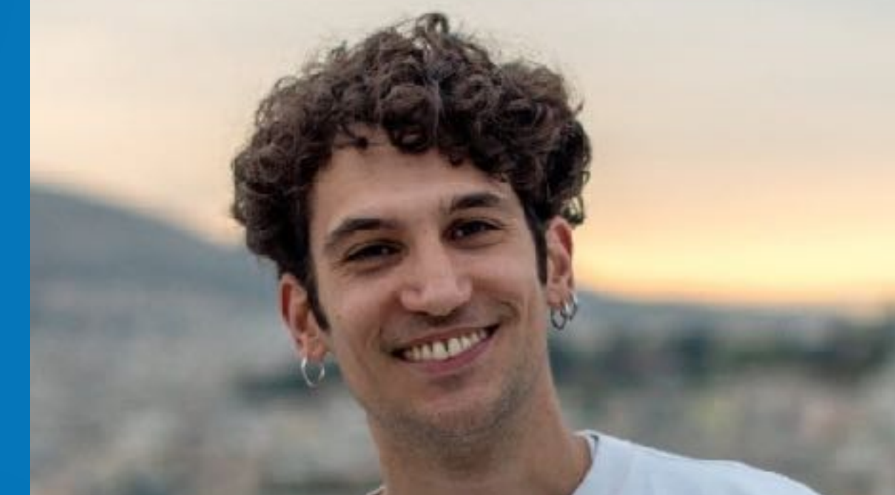
Ορέστης Χαλκιάς, ηθοποιός