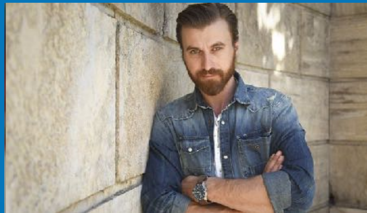
Σόλων Τσουνής, ηθοποιός