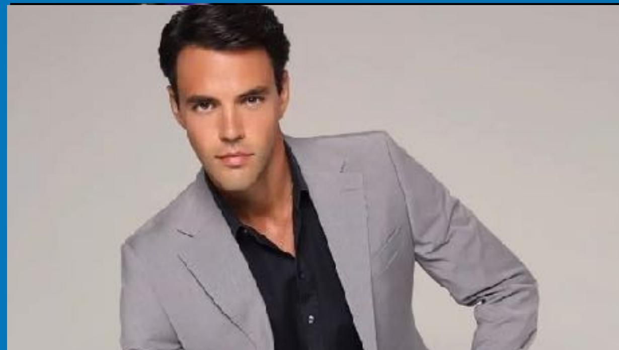
Ρένος Ρώτας, ηθοποιός