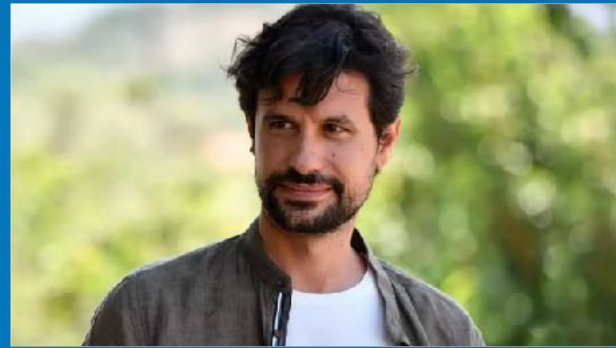
Ορφέας Αυγουστίδης, ηθοποιός