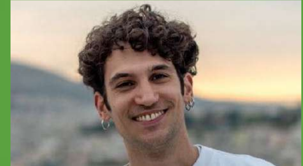
Ορέστης Χαλκιάς, ηθοποιός