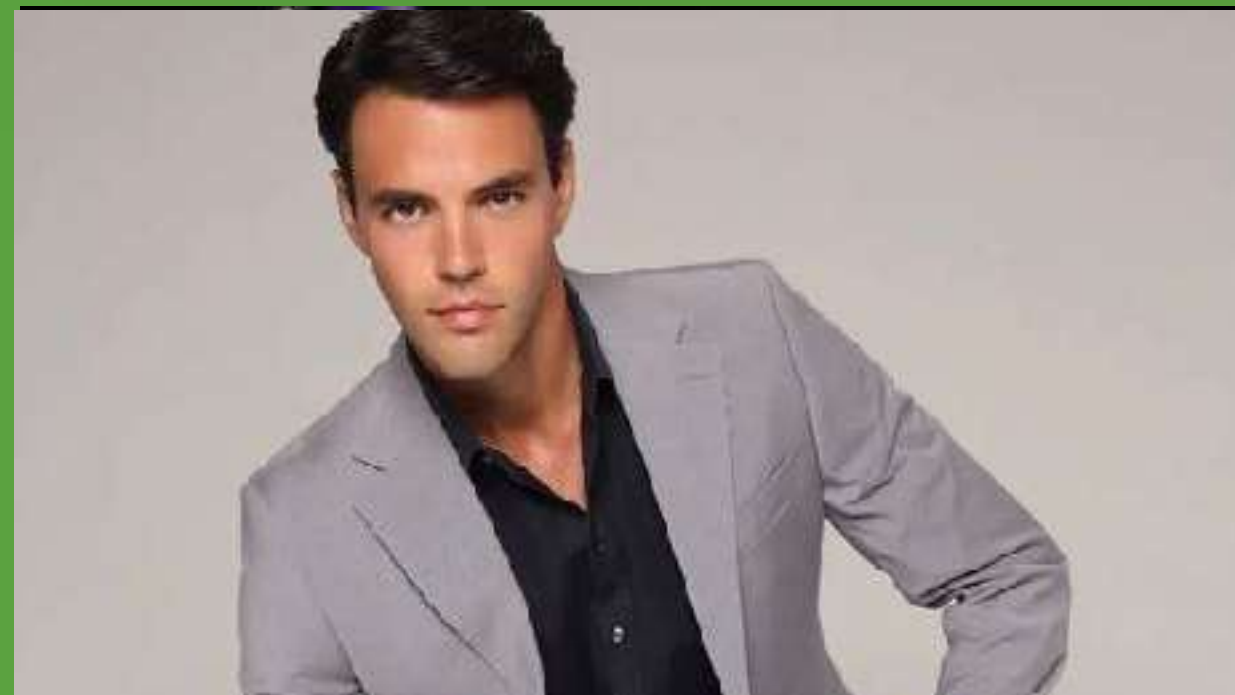
Ρένος Ρώτας, ηθοποιός