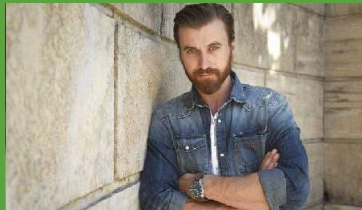
Σόλων Τσουνής, ηθοποιός