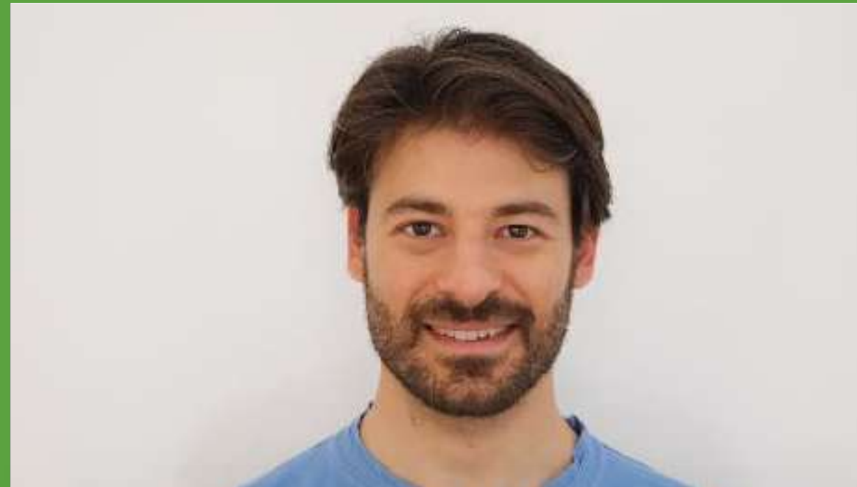
Θάνος Λέκκας, ηθοποιός, βιολόγος