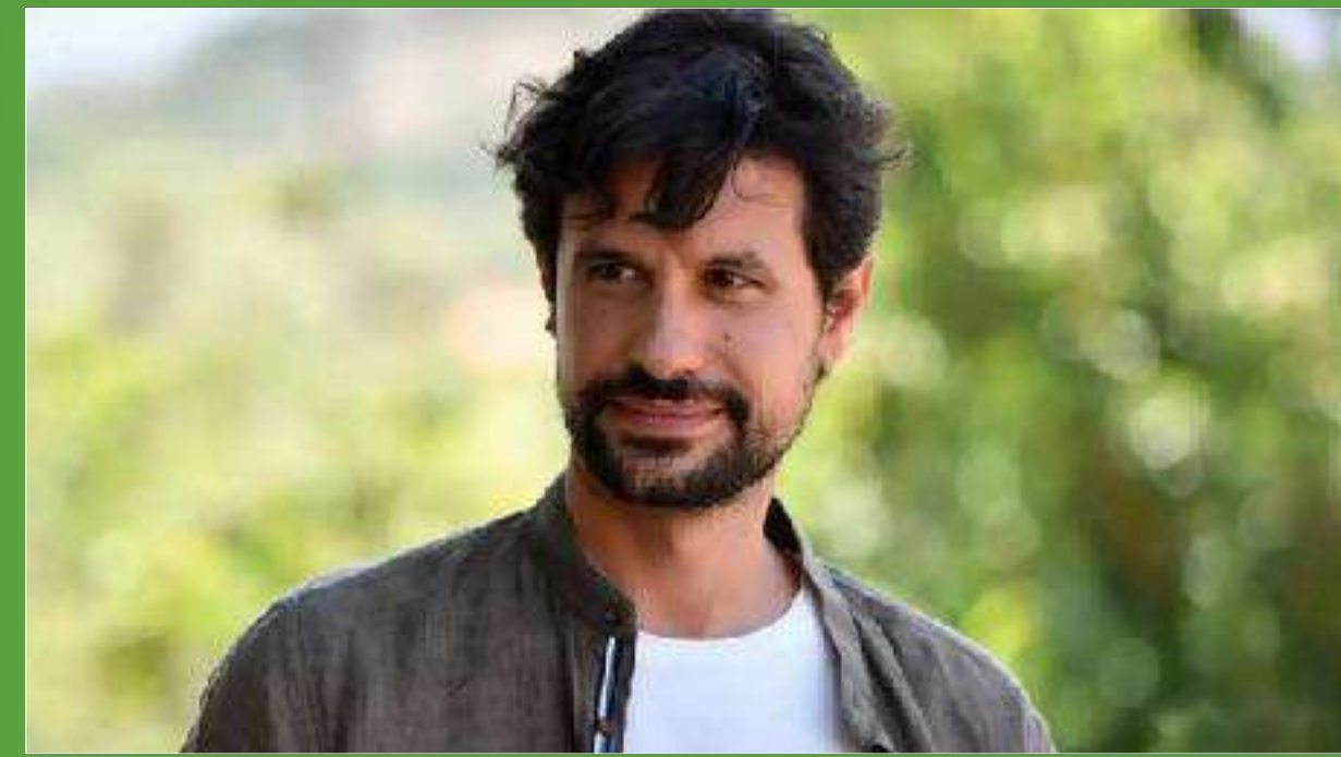
Ορφέας Αυγουστίδης, ηθοποιός